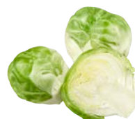
Chou de Bruxelles